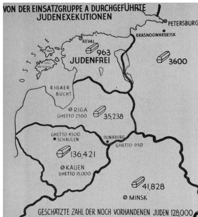
Figure 1 : une carte très explicite quant au sort des juifs de Lituanie, d'Estonie, de Lettonie et d'une partie de la Biélorussie et de la Russie actuelles. Ici les exécutions de l' Einsatzgruppe A . Nous remarquons aussi que l'Estonie est déclarée purgée de sa population juive 9 .

Les Einsatzgruppen n'ont pas seulement massacré des Juifs, mais aussi des civils soviétiques, des Tziganes, des communistes et beaucoup d'autres personnes ; mais il ne fait aucun doute que la plupart de ces gens étaient juifs et que la résolution de la «solution finale» commença par les groupes d'intervention 10 . Quant à la question du nombre de victimes, personne ne peut réellement trancher. Selon les historiens, il varie d'un peu moins d'un million à un million et demi voir deux millions. D'après Raoul Hilberg le nombre victimes des Einsatzgruppen A, B, C et D serait de plus de 700 000 11 . Mais, même si ce chiffre semble trop élevé selon les négationnistes, il ne peut pas être d'une dizaine de milliers de victimes seulement, comme nous l'indique Graf 12 . En comptant toutes les fusillades (celles des : « Einsatzgruppen, chefs suprêmes des SS et de la Police, armées roumaines et allemandes dans les opérations mobiles, fusillades en Galicie pendant les déportations, exécutions des prisonniers de guerre en Serbie et ailleurs » 13 ), Raul Hilberg arrive à un chiffre qui dépasse 1 300 000 victimes.