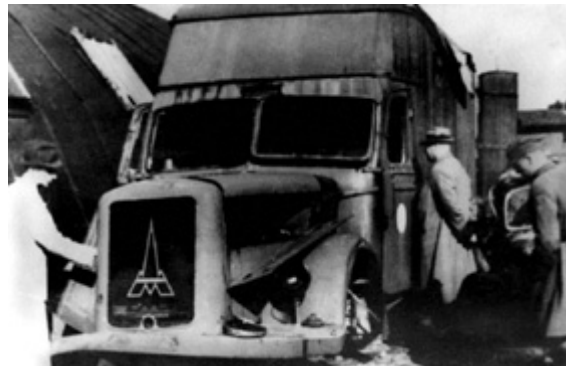
Figure 5 : Un des camions du camp de Chelmno transformé en chambres à gaz mobiles 80

Les juifs arrivés à Chelmno devaient d'abord se diriger vers le château où ils se déshabillaient. On leur avait auparavant raconté, pour les rassurer, qu'ils devaient passer à l'épouillage avant d'aller travailler dans un camp. Ils devaient par la suite descendre à la cave. Ils sortaient enfin du bâtiment pour arriver à une rampe en bois qui conduisait au camion à gaz. Les victimes devaient entrer dans le camion qui se tenait à l'arrière et dont les portes étaient grandes ouvertes. La plupart entraient docilement, ayant été dupées. Une fois que trente-cinq à quarante personnes se trouvaient à l'intérieur on fermait les portes, puis le chauffeur du camion mettait en marche le moteur pendant dix minutes environ. A l'intérieur on entendait des cris et des râles. Quand tous étaient morts, on conduisait les cadavres, par le même camion qui avait servi à les tuer, dans une forêt où les corps étaient enterrés dans des fosses communes 79 .